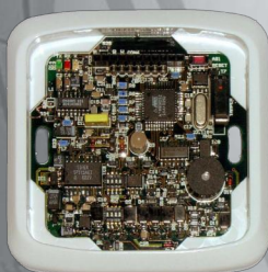
Pohled z elní a zadní strany